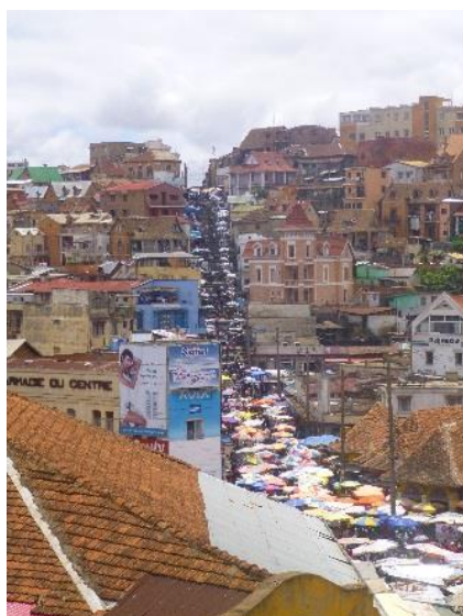
Les escaliers d'Analakely au centre-ville

Il faut avouer que le commencement met un peu de temps à se mettre en place... Après avoir fait tous nos bagages et dit au revoir à tout le monde, on a commencé par attendre 3 semaines supplémentaires en France pour obtenir des papiers de Madagascar nous servant à demander nos visas. Nous voilà donc enfin à l'aéroport le 5 octobre, bien décidés à commencer le travail ! Mais l'attente continue encore un peu à Madagascar. En effet, à cause de l'épidémie de peste qui inquiète le pays, les autorités reportent chaque semaine la rentrée des classes pour éviter la propagation de la maladie. Nous sommes donc toujours en « vacances de peste » comme disent ici les malgaches en riant ! Rassurez-vous toutefois, nous ne sommes pas malades, et a priori, on ne risque pas grand-chose dans le quartier où nous vivons. Mais on voit bien que ce désagrément est très présent : campagnes de prévention partout dans la ville, certains magasins prennent notre température avant de nous laisser entrer, les médias en parlent beaucoup, etc. On espère et on prie pour que la situation s'améliore rapidement.