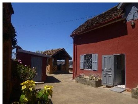
Notre maison !!

Ce temps de congé nous a permis de bien nous installer. Nous habitons dans une grande maison, juste à côté de la maison des sœurs de Mamré qui nous accueillent, dans un quartier en haut de la plus haute colline de Tana, à plus de 1400 m d'altitude. On est bien lotis, un peu éloignés de la pollution et du bruit du centre-ville, d'autant que le quartier est uniquement piéton. Et nous avons une grande terrasse avec vue imprenable sur la ville, on ne se lasse pas de la regarder !