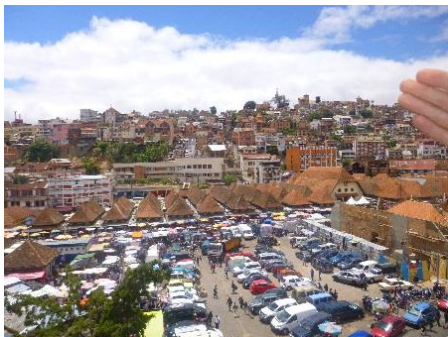
Le centre-ville et le marché d'Analakely

point porte sur la différence de contexte religieux entre nos pays : l'Europe connaît une décroissance du nombre de paroissiens présents régulièrement à l'église alors que Madagascar est en plein essor du christianisme. De nombreux malgaches sont attirés par la foi en Jésus Christ et la FJKM mène une large campagne d'évangélisation très efficace. Le président nous a donc vivement encouragé à participer à cette dynamique en étant actifs dans les paroisses locales mais également dans les missions que nous allons accomplir auprès des enfants. Le président ajoute que nous sommes ici pour apporter, mais aussi pour recevoir, et que peut-être nous pourrions tirer profit de cet élan présent pour découvrir et ramener en France une autre manière de vivre la foi. Ces réflexions nous touchent et nous donnent matière à réfléchir.